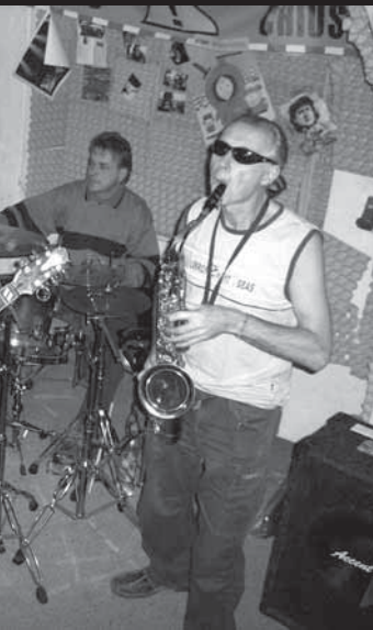
stala skupina Sírius.

SLOVÁCKÉ DIVADLO UHERSKÉ HRADIŠTĚ www.slovackedivadlo.cz