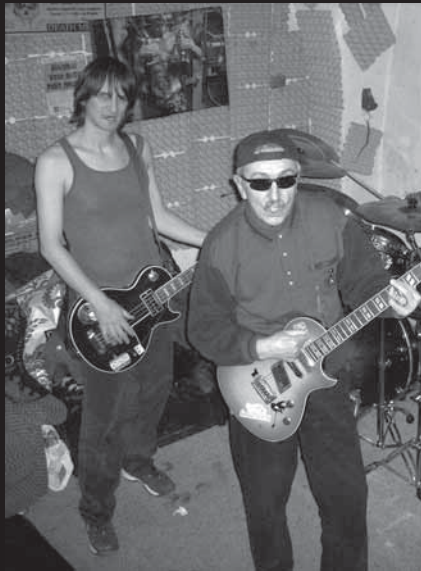
Hudbu nahrála a sponzorem inscenace se tím s